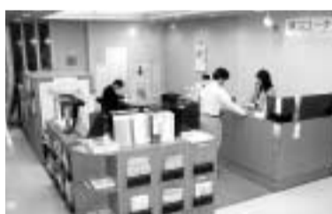
市役所情報コーナー

市議会本会議の様相を、市役所に来庁された市民の皆様にご覧いただけるよう、議場内にテレビカメラを設置し、本会議開会中、本庁舎1階並びに西棟1階のロビーにおいて放映しておりますので、ぜひご覧ください。