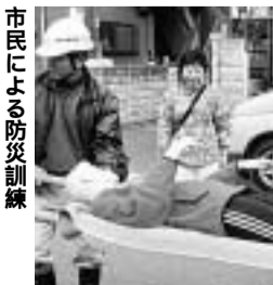
市民による防災訓練

〔答弁〕健康福祉部長「グループホームや生活ホームについては、知的障害者の方々が地域の中で自立した生活を送る場として必要な施設であると認識している。市では今後、生活ホームについて社会福祉法人や障害者福祉団体が設置できるように、必要な支援を行っていきたくと考えている。