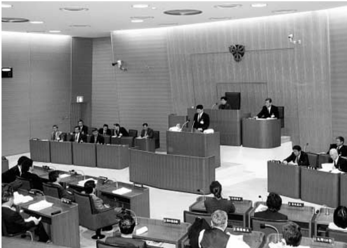
3月定例会本会議場で

平成14年3月定例会は、2月27日から3月23日までの25日間にわたり開かれ、市長から提出された平成14年度草加市一般会計予算など44議案を原案どおり可決しました。議員提出議案は、雪印食品牛肉偽装事件の徹底解明と食品表示制度の改善・強化を求める意見書など20議案が提出され、15議案を可決しました。開会日には、平成14年度の市政運営に臨む市長の政治姿勢や所信について施政方針演説が行われ、これに対し、各会派代表5人の議員がそれぞれ質疑を行いました。市政に対する一般質問では、18人の議員が4日間にわたって登壇し、諸施策について執行部の方針や見解をそれぞれたずねました。また、市長提出議案に対する質疑では、延べ11人の議員が質疑を行いました。