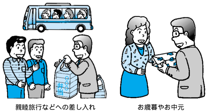
親睦旅行などへの差し入れ