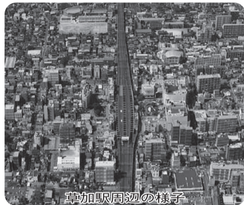
草加駅周辺の様子

答弁 平成26年度は、運動、食生活、生活習慣など、健康に関する簡単な知識を習得してもらい、地域の中で広げてもらう健康づくり応援隊の養成を行っているほか、S.K.T24ムービーの公開や青年向けのリーフレットの作成によりS.K.T24の周知を行っている。平成27年度は、「そうか みんなで健康づくり計画」に基づいてS.K.T24のさらなる推進を初め、健康づくりのさまざまな取り組みを市民の皆様とともに着実に広げていく。