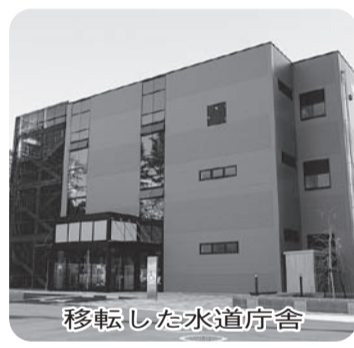
移転した水道庁舎

北部地震等に備えて、解体後の跡地に耐震性を有した配水池を建設するためであり、今後の事業スケジュールは、平成27年度からの2カ年で吉町浄水場庁舎の解体工事を行い、平成28年度からの2カ年で配水池の建設工事を行う予定。