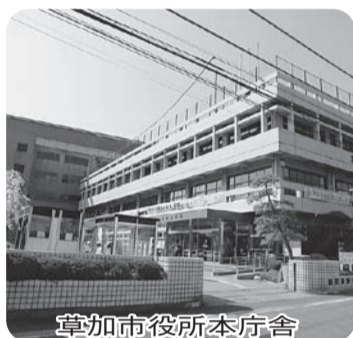
草加市役所本庁舎

【答弁】本庁舎の整備手法としてPFIを検討するために、事業の範囲や事業期間等を設定し、民間事業者へのヒアリング等を行うとともに、草加市の人口の約1%に当たる2500人を対象に、庁舎に求められる役割や機能等についての市民意向の調査を実施する。