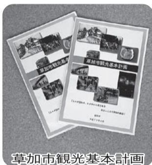
草加市観光基本計画

【答弁】この事業は、平成26年度に総務大臣並びに経済産業大臣から認定を受けた草加市創業支援計画に基づく事業で、開業資金300万円程度の創業を期待し、創業啓発講演会を年間2回、創業塾を年間4回、創業支援型空き店舗活用事業を1件分