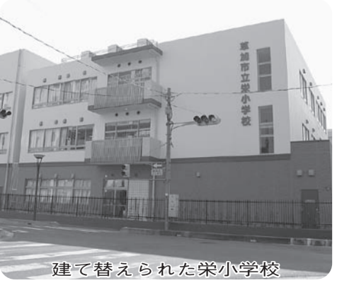
建て替えられた栄小学校