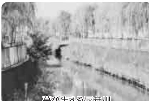
草が生える辰井川

〔答弁〕建設部長「辰井川は埼玉県が管理する一級河川であり、河道内のコンクリート上に堆積した土砂と雑草の除去については下流