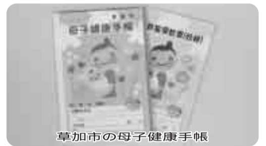
草加市の母子健康手帳

理由がある場合や緊急性が認められる場合、または、特殊な技術等が必要な場合を除き、原則複数社による競争性が発揮されるようにするため、現在、随意契約における事務処理基準を作成中で、今後も公平性・透明性の高い契約事務手続きに努めていく。