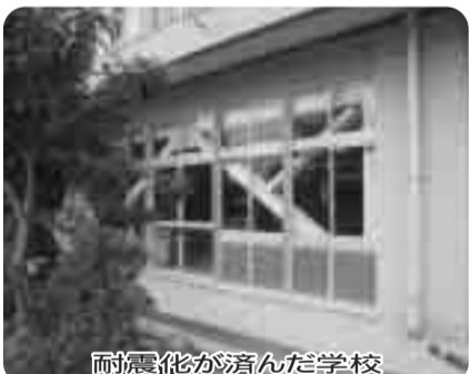
耐震化が済んだ学校

〔答弁〕教育総務部長「教育委員会としては、計画に対して今後市内4校の高校の先生方との連携を図り、共通理解を持つことに努めていく。皆様からの要望がある場合には、校長先生と協議する中で必要に応じて県教育委員会に伝えることも可能と考える。