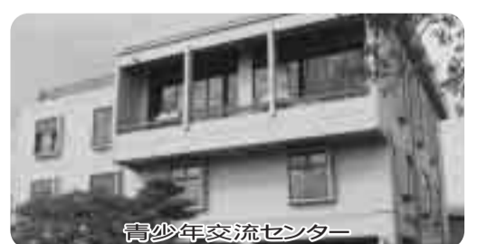
青少年交流センター

〔質問〕関議員「子どもたちが健やかに育っていくためには、安心して過ごすことができる居場所が必要であり、居場所づくりは重要なことだと考える。杉並区には、児童青少年センターと男女平等推進センターの複合施設があり、利用者の声を生かすため、中・高生