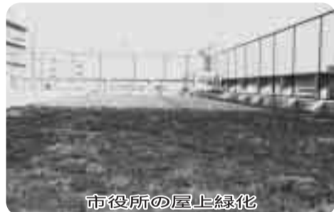
市役所の屋上緑化

〔答弁〕市民生活部長「平成15年度に実施した効果測定で天候が晴れの日では、屋上と芝の中の温度差が約15度であり、ヒートアイランド現象を軽減し、省エネルギー効果をもたらす