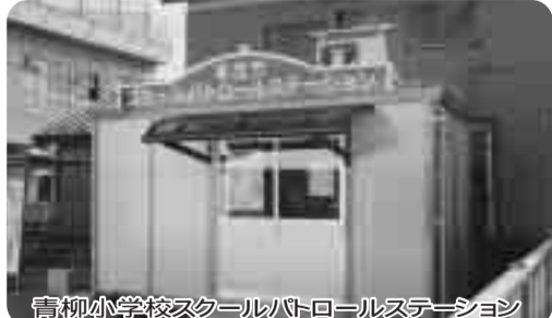
青柳小学校スクールパトロールステーション

〔答弁〕学校教育部長、小学校の余裕教室等を利用して7校、プレハブを建設した11校、近隣のパトロールステーションを利用した4校があり平成18年10月から22小学校区の中で活動を開始している。基本的な考え方は、各学校に設置されている安全・安心推進連絡協議会が主体となり、それぞれの実態に応じた具体的な方法を検討している。進め方は学校により異なるが、共通点として低学年児童の下の校時の防犯活動に重点を置き、下校児童の見守り活動と通学区域のパトロール活動等を行っている。