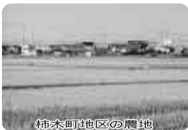
柿木町地区の農地

〔答弁〕総合政策部長、農業者が高齡化のため一時的に休耕地となるものが見受けられるが、高齡等の理由で耕作が困難な場合は市民農園として整備し農地を保全するという活用方法も、ご案内をしている。柿木町地区を取り巻く環境の変化の中で農業者の意向を