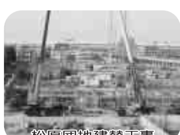
松原団地建替工事