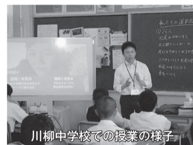
川柳中学校での授業の様子

答 平成30年度は中学校1年生のみを対象としていたが、令和元年度からは中学校3年生まで対象を広げ、登録者数は315人から467人となり、匿名での相談件数は延べ70件。