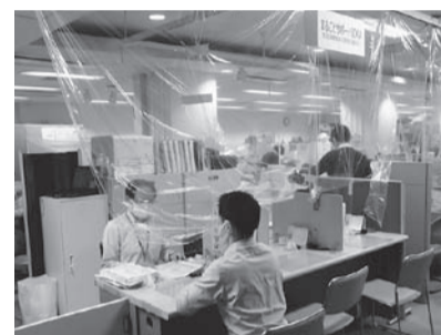
*まるごとサポートSOKA 仕事、生活や家庭の問題など様々な悩みを抱えて、生活に困っている人のための相談窓口

答 令和元年度の相談実績は、新規相談受付656件、プラン作成396件、就労支援261件、就労・増収151件。