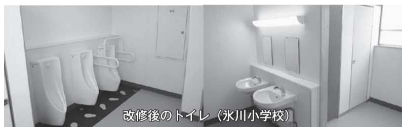
改修後のトイレ（氷川小学校）

令和元年度末で小学校全ての37棟、中学校1棟のトイレ改修工事が完了したため、残りは中学校の25棟である。全体の進捗率は60.3%（前年度48.4%）。