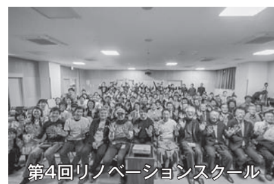
第4回リノベーションスクール

る事業については、令和元年11月に新たに2案件が事業化したことで、合計で全11案件中9案件が受講生により事業化した。