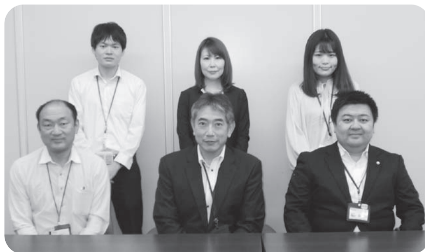
インタビューに応じてくださった教育委員会の職員の皆さん

今年は新型コロナウイルス感染症拡大防止のため、小中学校では約3か月にわたり臨時休業が実施され、公民館等においては様々な事業が中止、延期を余儀なくされています。教育委員会としましては、このような状況であっても、全ての子どもたちに切れ目のない学びを保障できるよう、オンラインによる家庭学習を可能とする環境整備を推進するとともに、社会教育分野においても感染症拡大防止対策を講じながら、より一層充実した生涯学習機会の提供に努めていきたいと思っています。