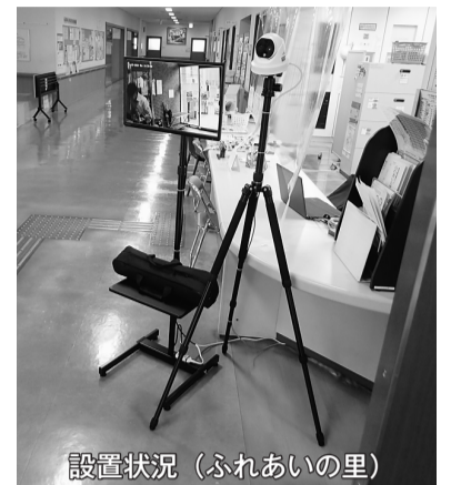
設置状況（ふれあいの里）

サーモグラフィー機器の購入台数は32台。サーモグラフィー機器の設置場所は、市庁舎等の行政施設、保健・福祉施設・社会教育施設・コミュニティ施設など、31施設。