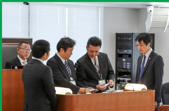
副議長選挙の様子