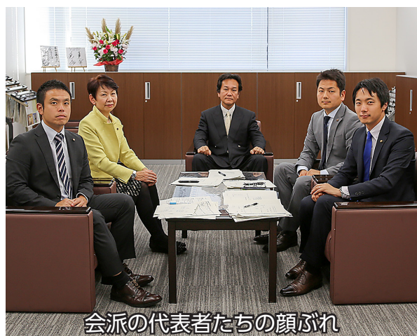
会派の代表者たちの顔ぶれ