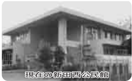
現在の新田西公民館

〔答弁〕生涯学習部長、清瀬小学校南側の隣接地が候補地であり、土地所有者から譲渡について内諾を得ている。今年度には基本設計・実施設計・事前環境調査及び地質調査等を行い、平成20年度から2力年で建設工事を進め平成21年度末の完成を予定している。敷地面積約2100㎡、2階建て、延べ床面積約12