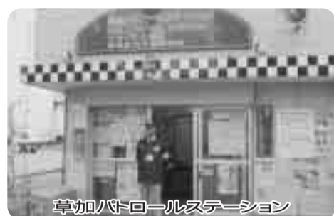
草加バトロールステーション

子どもや親などからSOSに瞬時に対応し、いじめられている子を守り、孤独感や疎外感から解放し、その後、学校関係者やいじめの側との仲立ちをしつつ、子ども同士の間関係の回復を図ることを目的とする仕組みをつくること