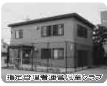
指定管理者運営児童クラブ

現在の産業振興の取り組み状況は、今年6月に、青年会議所から草加アニメタウン構想が提言されたが市の考え方は、