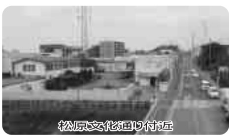
松原文化通り付近

〔質問〕浅井康雄議員、中根一丁目内の法定外公共物が平成19年2月21日に民間会社に売却され、3カ月後にマンション開発業者へ転売されたことが明らかになった。この土地は地元住民から何度も道路拡幅や公