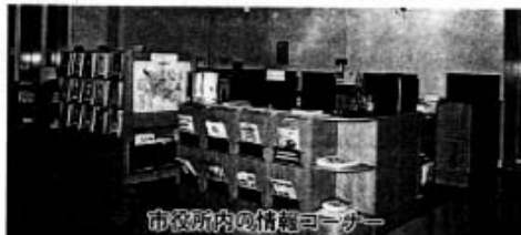
市役所内の情報コーナー