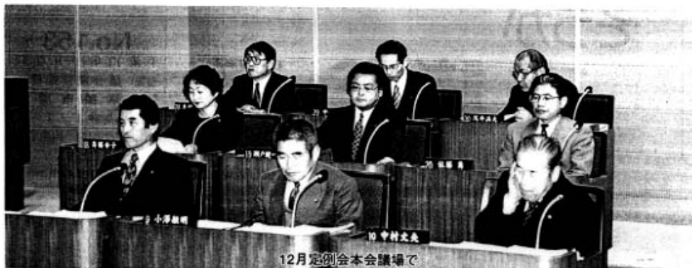
12月定例会本会議場で