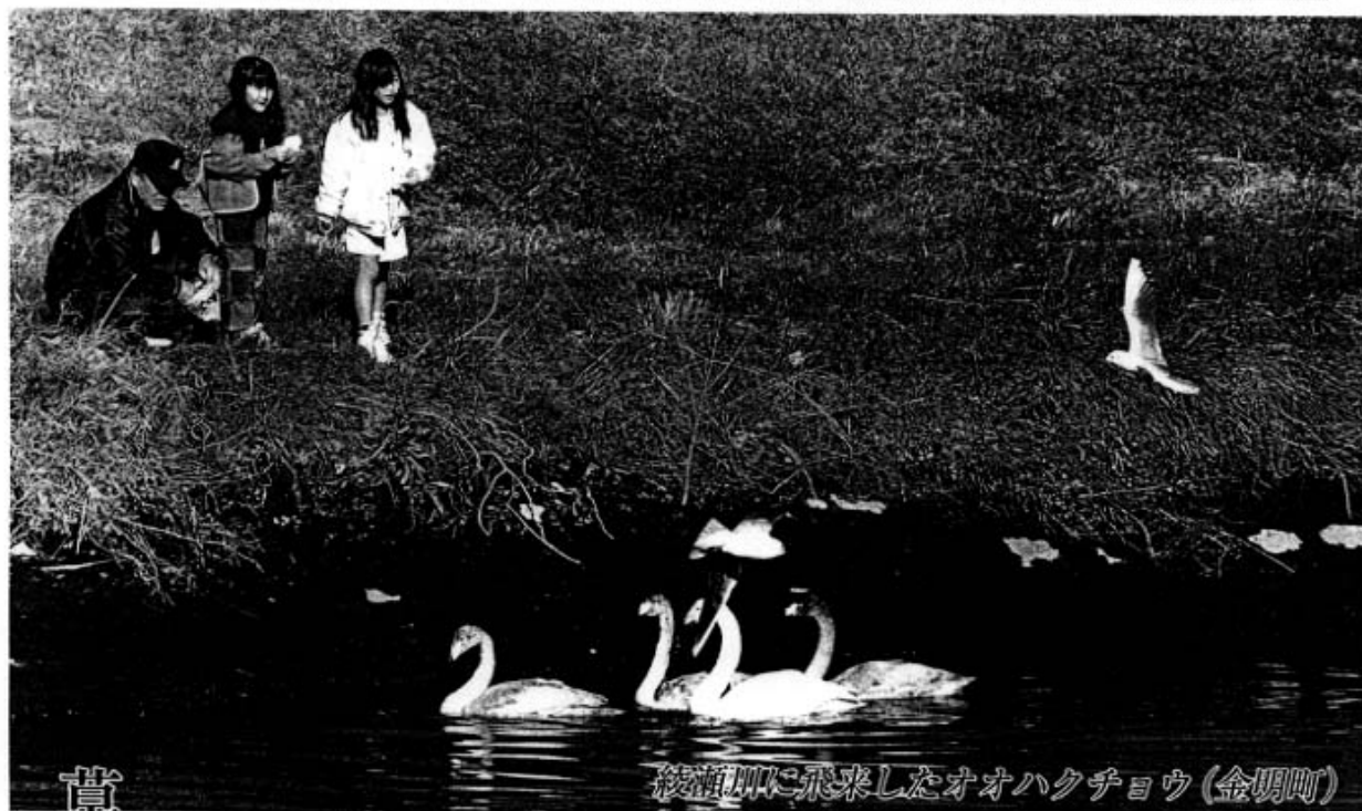
綾瀬川に飛来したオオハクチョウ(金明町)