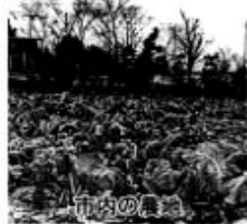
激増する野菜等の緊急 輸入制限(セーフガード) の発動を求める意 見書

議員提出議案は、「入札制度の改善を求める決議」など、7議案が提出され6議案を可決、1議案を否決しました。可決した意見書は、12月19日付けで関係行政庁へ送付しました。(意見書は要旨を掲載)