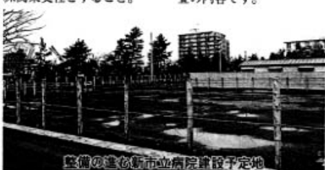
整備の進む新市立病院建設予定地

また、新市立病院建設工事に係る地質調査業務委託については、契約額1,365万円、委託期間を平成12年9月29日から平成12年12月18日、受託業者を応用地質㈱関東支社とすること。