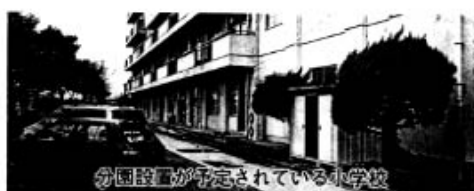
分園設置が予定されている小学校

答弁 健康福祉部長～乳幼児医療費の支給対象年齢の引き上げについては、乳幼児医療費支給制度が県の補助制度を活用して事業を実施しているところでもあり、支給対象年齢を引き上げた場合は、経費の全額を市が単独で負担することになるため、必要な財源の確保が課題となってくる。しかし、乳幼児が必要とする医療を容易に受けられるよう施策を講じることは大変重要との認識から、様々な検討を行い、入院にかかわる医療費については、対象年齢の引き上げに向け必要準備を進めていく。