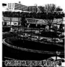
駅前広場改修工事の様子

東・西口の駅前広場については、駅周辺に居住されている市民だけでなく、駅勢圏を考慮し、設計施工した。③市内の整備済みの駅前広場と同様に、ロータリー機能の確保を最優先と考えており、停車スペースを設けることで広場内交通の円滑さに影響することが予想されるため、実現は相当困難と考えている。④駅前広場のトイレ設置は、広場周辺に適当な場所を見つけたらその確保に努め、設置に向け関係部課と協議していきたいと考えている。