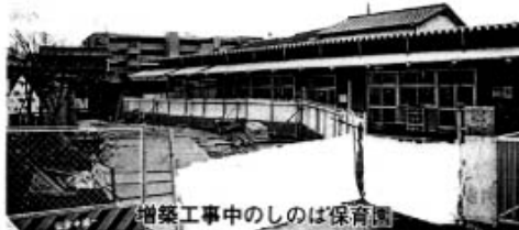
増築工事中のしのは保育園