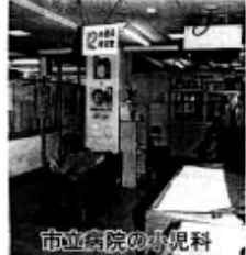
市立病院の小児科