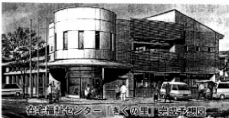
在宅福祉センター「さくの里」完成予想図