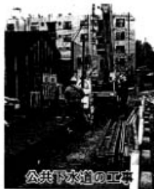
公共下水道の工事