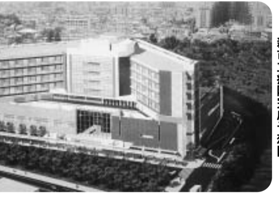
新市立病院完成予想図

向を伝えて12月11日に県へ連達した。②綾瀬川左岸地域は、都市計画マスタープランにおいて、市の文化ゾーンとして位置付けられており、全体の景観を保ち、シンボルゾーンという基本的な考えに即したまちづくりを誘導していきたいと考えている。今後の整備については、庁内の検討チームで地区の計画づくりを進める中で検討していきたい。③3月定例会の答弁は、選択肢の一つとして答えたもので、具体的に浄化施設を設置するものではない。リース料は、約55万円かかるかと試算している。