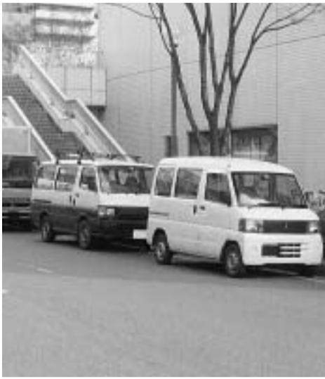
迷惑となっている違法駐車

〔質問〕今村議員→市内の外国人登録者のうち就学年齢の子どもの何人か、うち市内小・中学校に通う子どもは何人か。また未就学児の保護者に対する通学を促す方策については、中途入学への対応も含め、どのような規模で実施する方向で、